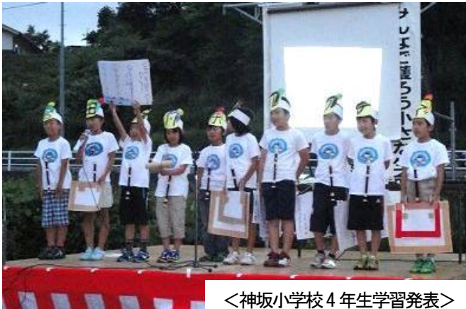
<神坂小学校4年生学習発表>