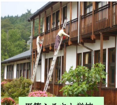
馬籠ふるさと学校

馬籠地推協は、6月14日(日)に馬籠ふるさと学校の環境整備作業を行いました。外周りの除草や樹木の手入れ、校舎の清掃や防腐剤塗布などを行って、ふるさと学校もこざつぱりと美しさがよみがえりました。