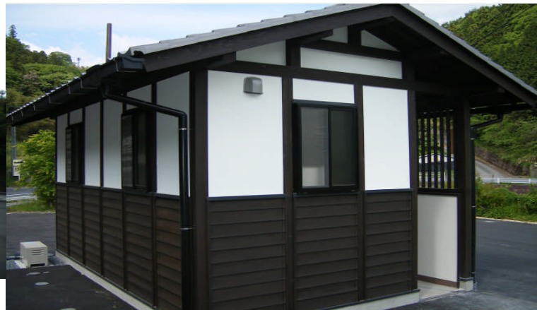
島田公園に整備された公衆便所 ▲