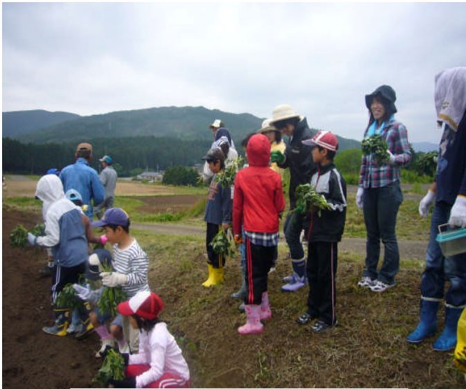
講師の説明を真剣に聞く 子どもたち