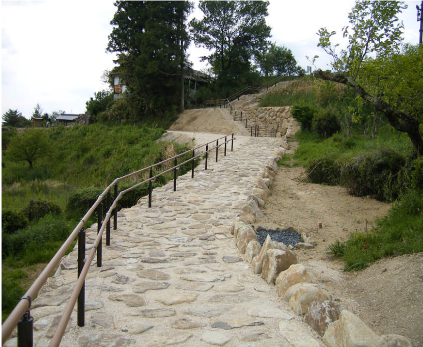
▲陣場から岩田までの中山道迂回路が整備されました（岩田から写す）

また4月から5月にかけて「馬籠地域づくり」や「馬籠観光協会」が、遊歩道沿いや島田公園を始め、馬籠地域全体に薄墨桜や百日紅などのたくさんの樹木を植樹しました。公と民が協働して住みやすい地域を作っています。樹木が育ちまた違った風情を見せてくれる事でしょう。