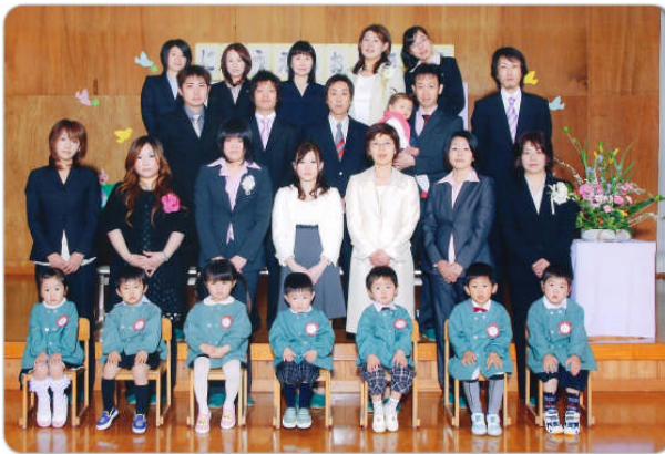
→ 山口幼稚園の入園式

子どもは地域の宝です。地域の皆さんにもこの子らの育ちを見守り、支えていただきたいと願っています。