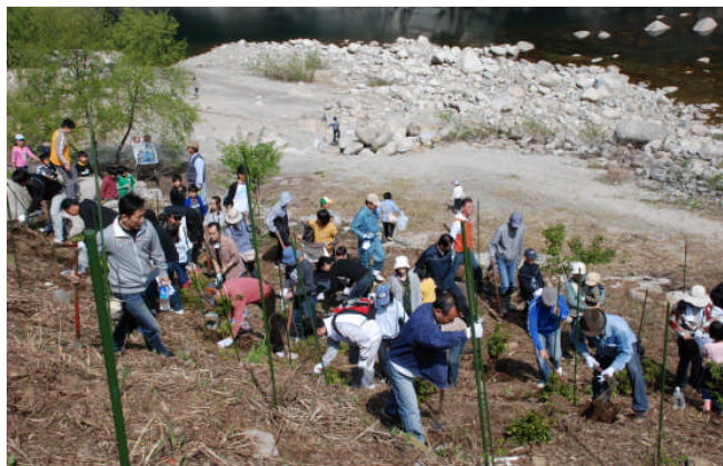
▲豊かな緑を夢見ながら植樹しました

した。木々が育つと共に公園も整備され、皆さんの安らぎの場となっていくことでしょう。植樹の後は、特産開発株により用意されたごへーもちと豚汁で空腹を満たし、楽しい時間を過ごすことができました。