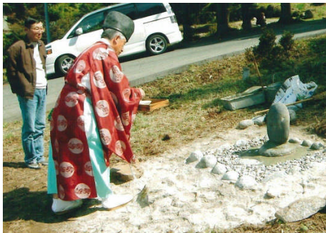
▲無事に引越しができました

地で、守り神としての役割を終えたかのようにひっそりたたずんでいました。今回、地域の歴史を継承しようということ、さらに上流にあったかつての水源に近い、種馬所の防火水槽脇にお祀りすることにしました。この日、防火水槽の清掃も行い、神事をおこなって水神碑を移設しました。その後、集会所でお花見を兼ねて移設を祝い、今後も地域の水源が豊かであることを祈りました。