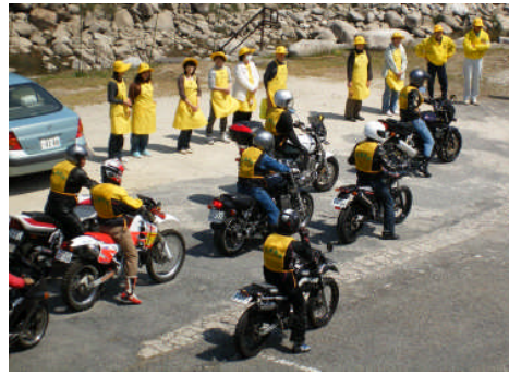
▲山口支部もキャラバン隊と合流

春の全国交通安全期間中の4月12日、ふるさとにぎわい広場を出発した交通安全キャラバン隊が、山口地区の道の駅『賤母』に到着し、交通安全の啓発活動を行いました。