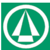
公民館のシンボルマーク→