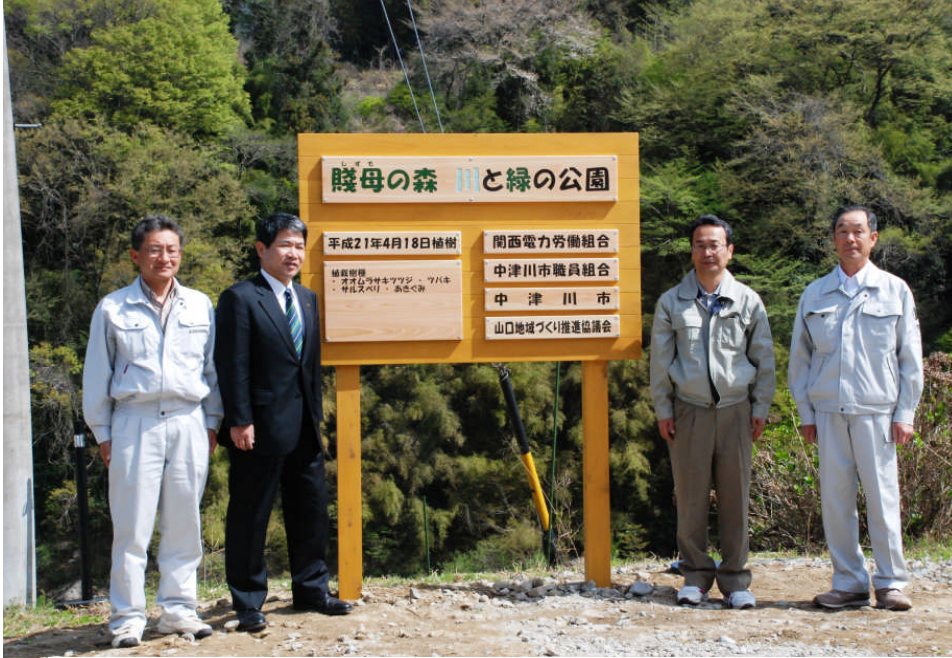
▲「賤母の森 川と緑の公園」の看板も除幕されました

平成21年5月1日 第45号 (毎月1日発行) 中津川市 山口総合事務所 (0573) 75-2126