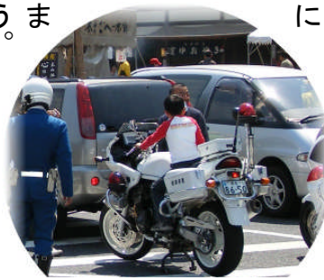
▲白バイかっこいい！！

た白バイに乗せてもらって喜ぶ子どもの姿もありました。これから外出する機会も増える時期ですが、事故を起こさない・事故に遭わない・なわなをよきようにつけましよう。