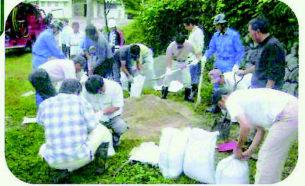
自主防災水防訓練