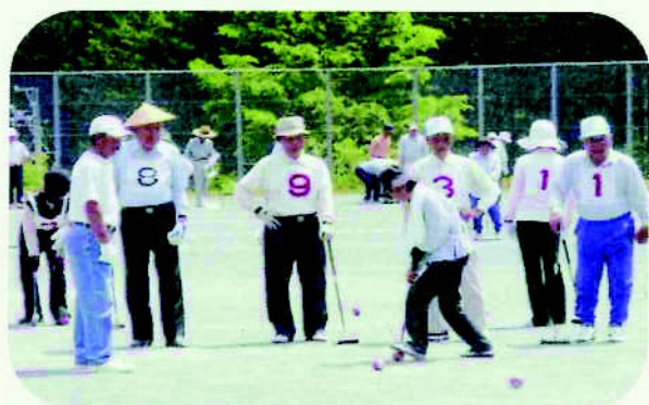
老人クラブ軽スポーツ大会