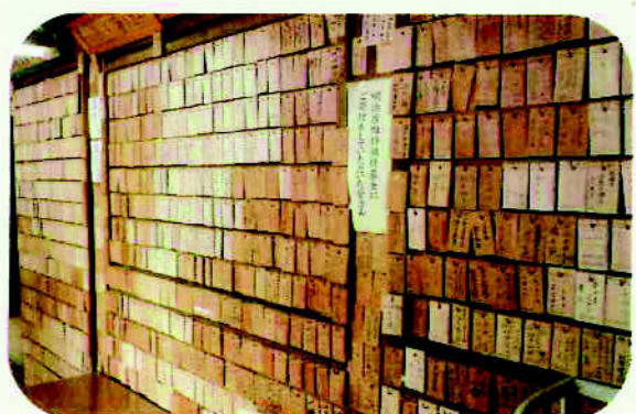
明治座瓦葺替寄付者木札