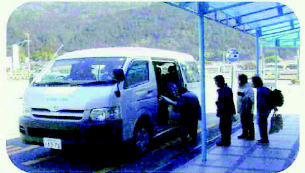
コミュニティバス