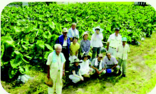
西方いも圃場巡回