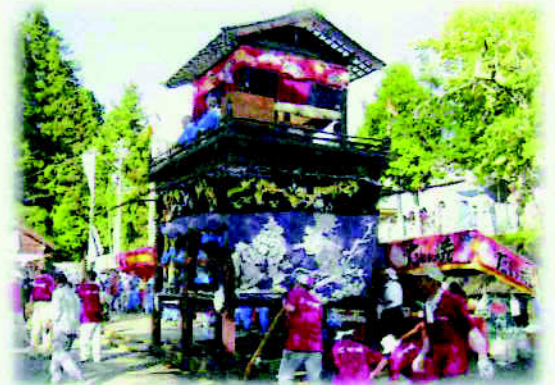
加子母総社水無神社の祭り