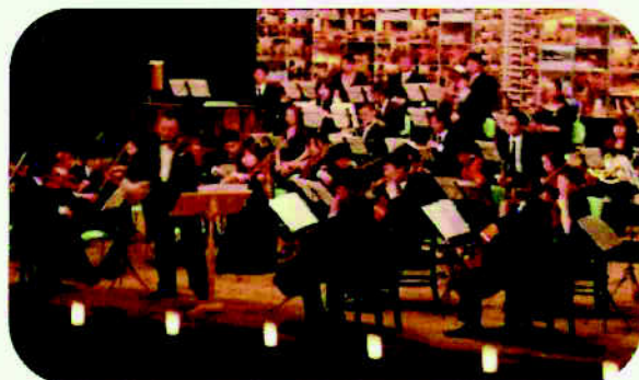
クラシックコンサート