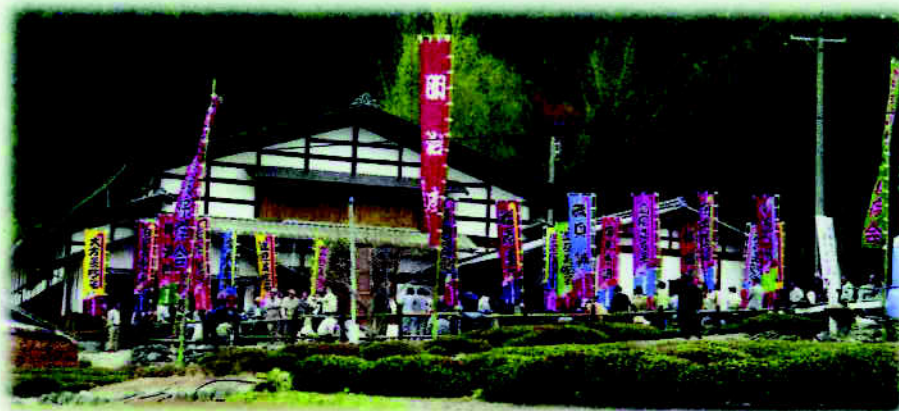
明治座歌舞伎公演