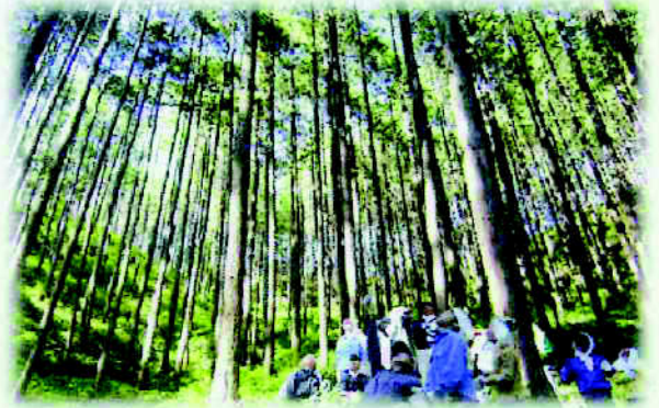
東濃ひのきの美林