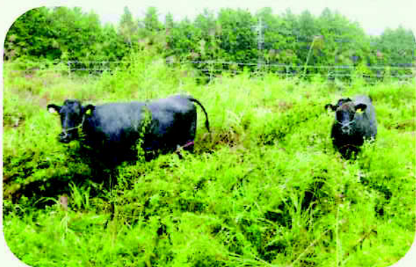
遊休農地牛の放牧