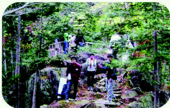
フレンドリーハイキング