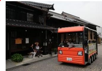
令和元年実施のグリーンスローモビリティ実証運行