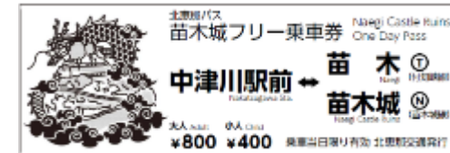
フリー乗車券硬券