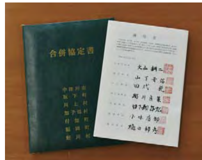
合併協定書(恵那郡北部町村)