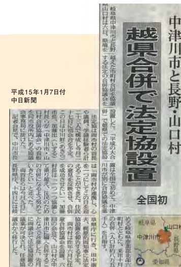
【付知町】 28日～30日 地区説明会(12会場)