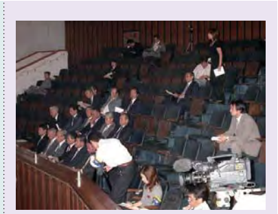
平成16年10月7日 岐阜県議事を傍聴