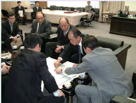
平成17年1月21日 新中津川市について麻生太郎総務大臣へ中津川市長と山口村長から説明