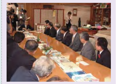
平成16年10月7日 傍聴後、岐阜県知事と懇談