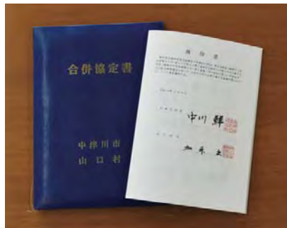
合併協定書(山口村)