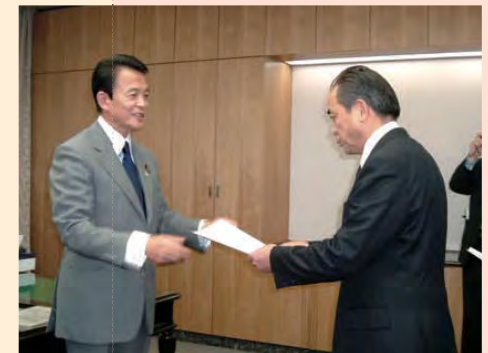
平成17年1月21日 麻生太郎総務大臣より合併決定書を受理