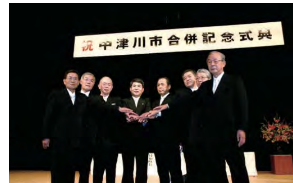
平成17年2月13日 中津川市合併記念式典