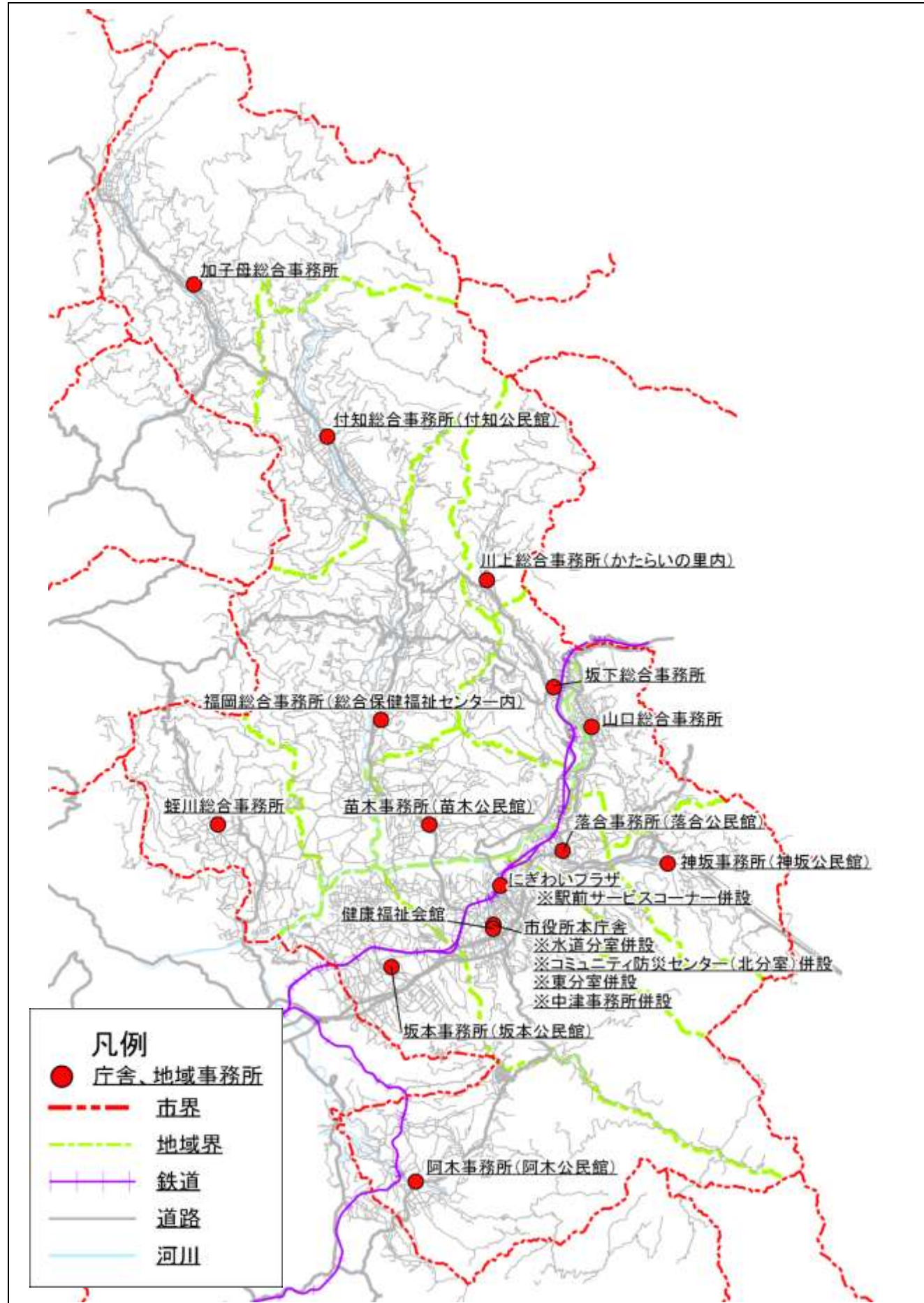
庁舎・地域事務所一覧表