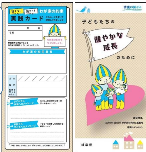
中学生向け「話そう！語ろう！わが家の約束カード（一部）」