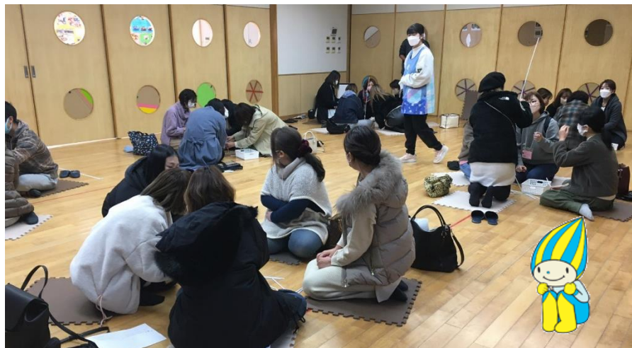
アイスブレイク 「ストロータワー」が一番高くできるのはどのチームでしょう。

TEL 0573-26-1111 (内線209) FAX 0573-25-7129 Mail shimakura-shinzo@pref.gifu.lg.jp