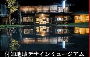
付知地域デザインミュージアム