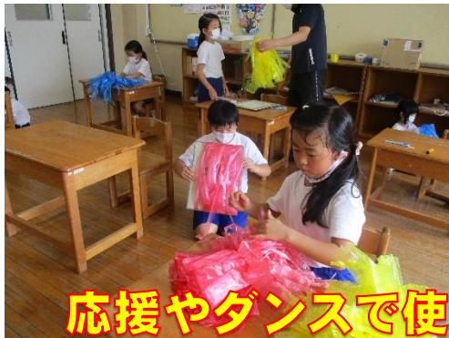
応援やダンスで使うポンポンの作成