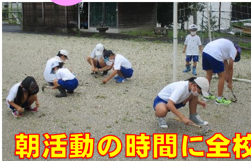
朝活動の時間に全校で草取りをしました

雨やコロナなどの“試練”に負けず、できることから順番に、運動会づくりを進めます。頑張ろう川上小!