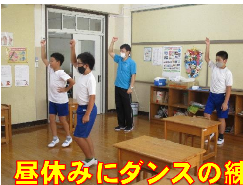
昼休みにダンスの練習をする団リーダー

上の写真は、高学年種目「とぶぞ! とぶぞ! とぶぞ!! バンブーリレー」の練習風景です。競技方法やルールを確認し、問題点がないか、子どもたち自身で検討します。この日はみんなの意見でハードルの高さを変更しました。なにせ子どもたちの意見をまとめてつくった“新種目”です。手作り感、創意工夫、試行錯誤を大切にします。