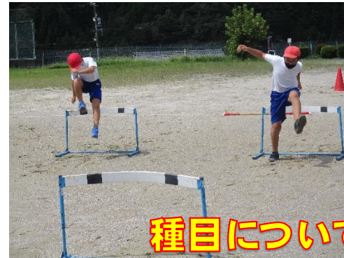
種目について知り、考える