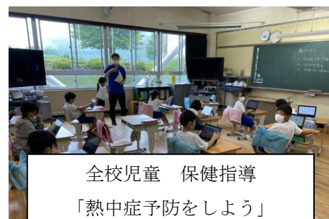
全校児童 保健指導 「熱中症予防をしよう」