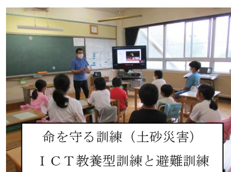
命を守る訓練（土砂災害） I C T教養型訓練と避難訓練