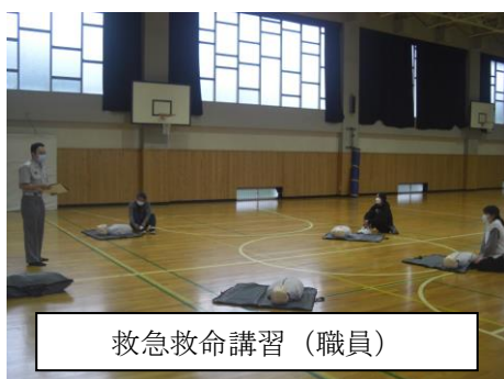
救急救命講習（職員）