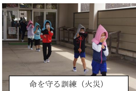
命を守る訓練（火災）