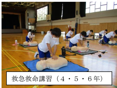
救急救命講習（4・5・6年）