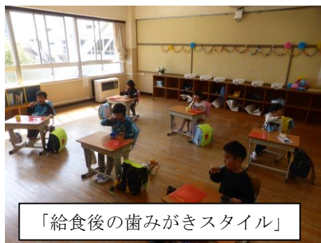
「給食後の歯みがきスタイル」