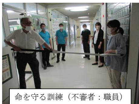
命を守る訓練（不審者：職員）