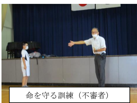
命を守る訓練（不審者）