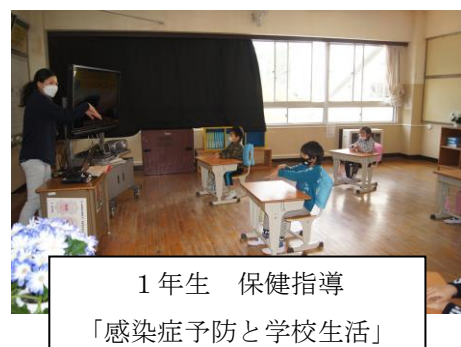
1年生 保健指導 「感染症予防と学校生活」