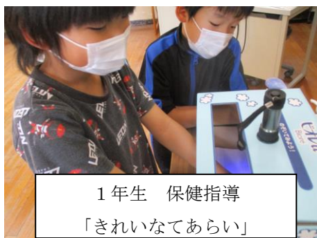
1年生 保健指導 「きれいなてあらい」