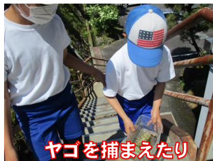
ヤゴを捕まえたり