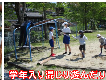
学年入り混じり遊んだり