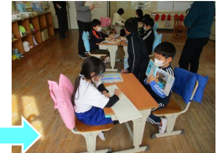
ペアになって考え方を交流