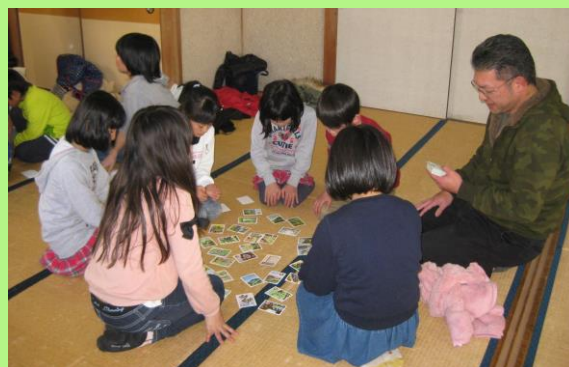
令和2年のカルタ取り大会