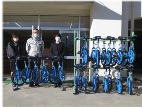
蛭川小学校 一輪車25台