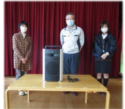
蛭川保育園 ワイヤレススピーカーアンプ 一式