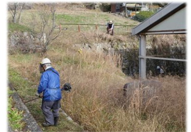
有志の皆さんによる草刈りの様子