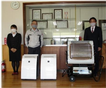
蛭川中学校 赤外線オイルヒーター1台 空気清浄機2台

11月26日(木)に蛭川中学校、12月8日(火)に蛭川小学校と保育園で贈呈式が行われました。子どもたちのために有効に活用させていただきます。ありがとうございました。