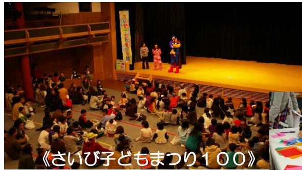
《さいび子どもまつり100》