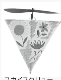
スカイスクリュー