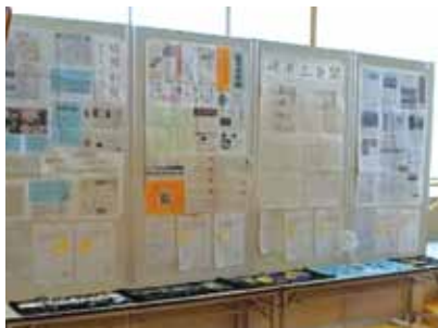
プレ大会で作成した記事の数々

会場には参加各校が日頃作成している学校新聞が展示されます。ぎふ総文は、これら普段の学校新聞とは異なり、他校の生徒さんとコミュニケーションをとりながら新聞を制作します。新聞部は、部によって人数や勢い、特色も異なるので、ごちゃ混ぜにすることで、お互いの新聞や部の状況も知ることが出来ます。デジタルが発達して、手間に感じることもありません。