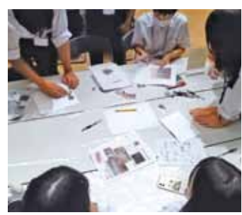
みんなで協力して制作します

他校の方とグループを組むことなど初参加の方は不安も多いかと思いますが、他校の特色や文化を知るとともに、他校の方と交流できて楽しかったと思ってもらえるような大会にしたいです。