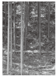
不用木を間伐し整理された森林

市のイメージアップを図るとともに、地域の森林整備に対する意識を高めるため、観光道路沿いの間伐を進めています。この事業は、県の森林・