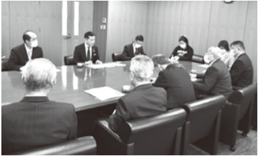
坂本地区懇談会の様子

令和2年度以降、新型コロナウイルス感染症拡大により中止していた市政懇談会を3年ぶりに開催しました。今年度は各地区代表と市長との面談形式として、各地域のまちづくりに対する取り組みの報告や課題・提言をテーマに7地区と懇談しました。