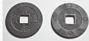
寶永通宝十文銭(個人蔵) 裏面(右)に「永久世用」の極印 直径約3.7cm 約9.4g

会期 3月31日(日)まで 江戸幕府が貨幣経済を推進する中、新貨幣に流通経済活性化の想いを込めて、宝永5(1708)年に製造された十文銭の「寶永通宝」は、裏面に「永久世用」の極印が施されていました。しかし、その期待に応えることなく、僅か一年余りで通用停