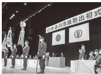
令和5年の式典の様子

消防職・団員による一斉放水や、駅前通りでの楷梯操法、幼年消防クラブ・女性防火クラブ・消防団員など約500