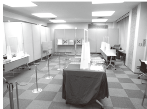
令和5年4月統一選(県議選)での市役所期日前投票所の様子 ※レイアウトは異なる可能性があります。

投票所に行き、投票用紙に自分が選んだ候補者の氏名を書いて投票するだけです。これだけでわたしたちの意見を政治に反映させるチャンスが生まれます。