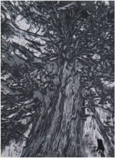
市長賞「加子母大杉」