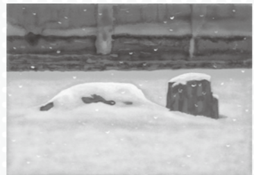
雪の石庭(習作)(セリグラフ)

を重ね合わせた繊細な心情や、古き良き日本の風情を遺してほしいという画家の願いが感じられます。悠久の歴史と文化が息づく繊細優美な日本の古都の美をご堪能ください。