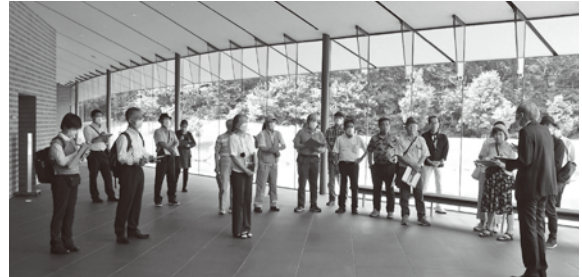
ホール内で施設の説明を受けている様子