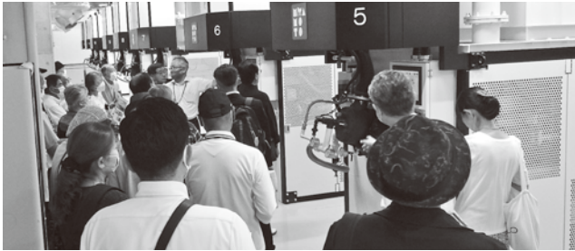
火葬炉裏側の機械室を視察している様子

7月3日、22人の市民の皆さんと共に、先進火葬施設の可茂聖苑(美濃加茂市)、華立やすらぎの杜(多治見市)へ視察に行ってきました。