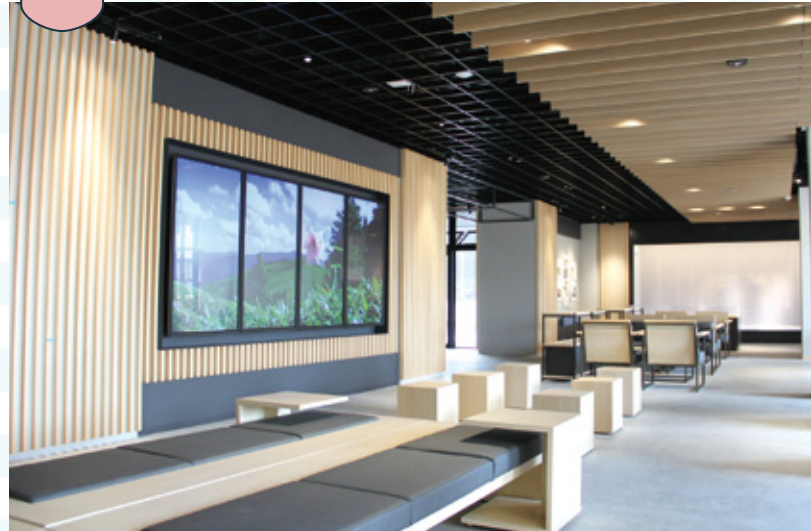
ラウンジには、観光情報や地域資源などを発信する大型ビジョンや展示、カフェではドリンクやスイーツのテイクアウトができます。④

ラウンジ、カフェ・ショップなど、市民や観光客が気軽に立ち寄れる空間で、市民サービスの窓口を備え、会議やイベントなど多目的な活動が可能な活動室やテラスがあります。