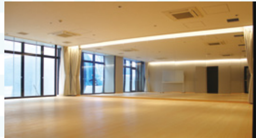
壁面が鏡になったフローリングの防音室。ダンスや音楽活動、上映会などに利用できます。②