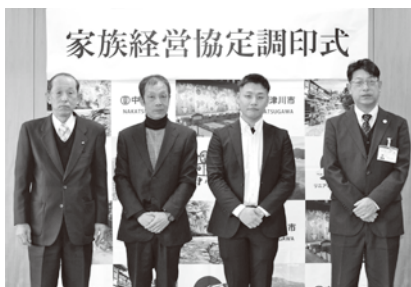
平井さん親子(中2人)