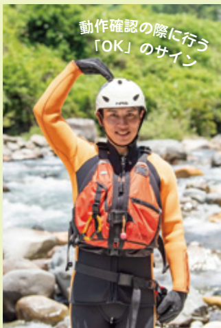
動作確認の際に行う「OK」のサイン

令和6年中の県内の水難事故は、魚釣り・魚取り中の事故をはじめ、水泳中、水遊び中に多く発生しています。