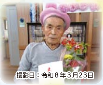
撮影日：令和8年3月23日