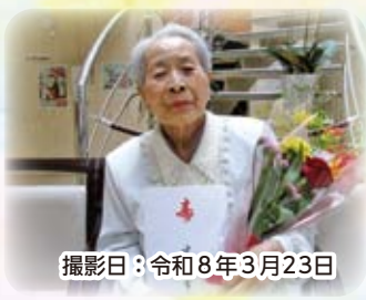
撮影日：令和8年3月23日