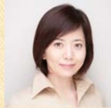
フリーアナウンサー 草野 満代氏