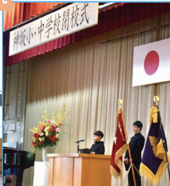
神坂小学校、神坂中学校