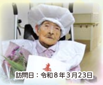
訪問日：令和8年3月23日