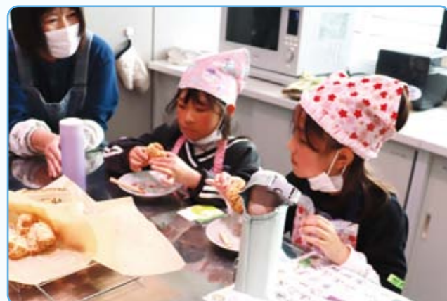
上手に焼けたね ひと・まちテラス