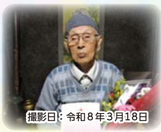
撮影日：令和8年3月18日