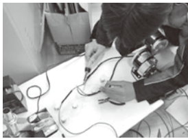
中津川市リニア企画展の来場者の注目を集めました