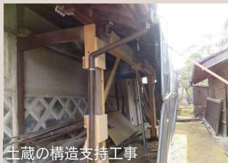
土蔵の構造支持工事