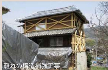
離れの構造補強工事

2010年2月に国史跡「中山道」へ追加指定された落合宿本陣は、岐阜県内で唯一本陣建築が現存する重要な史跡です。この落合宿本陣を守り後世へ伝えるため、市は土地建物を公有化しました。しかし、最大で築200年余りを経た史跡内の建物群は老朽化が目立ち、応急的な修繕を繰り返しているものの、土蔵や離れは老朽化や雨漏り等で蓄積した歪みによって安全性が損なわれています。