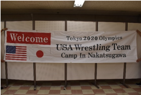
横断幕 (Welcome USA)