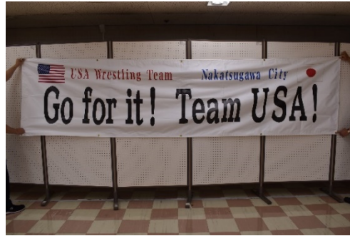
横断幕 (Go for it!)