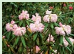
シャクナゲ 付知峡