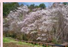
シデコブシ 坂本(岩屋堂)