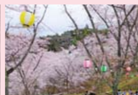
桜 苗木さくら公園