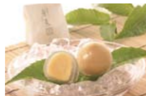
夏におすすめ栗菓子

朴の葉の上に酢飯をのせ、鱈やシイタケの甘辛煮などを盛り付けた郷土料理。初夏～夏にかけて販売されます。