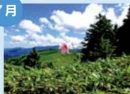
ササユリ 富士見台高原