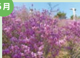
ツツジ 根の上高原