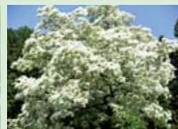
ひとつばたご 蛭川